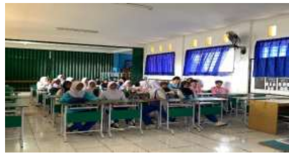
Gambar 2. Dokumentasi.

Berdasarkan hasil pre-test dan post-test pada siswa/siswi SMP Al Amanah yang berlokasi di Jl. AMD Babakan Pocis No. 10, kelurahan babakan, kecamatan setu, kota Tangerang Selatan, provinsi banten dengan total peserta sebanyak 25 orang, presentase rata-rata score pada saat pre-test dan post-test dapat dilihat pada diagram berikut: