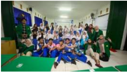
Gambar 1. Dokumentasi

Berdasarkan hasil penyuluhan yang telah dilakukan maka dokumentasi saat pelaksanaan berlangsung dapat dilihat pada gambar berikut: