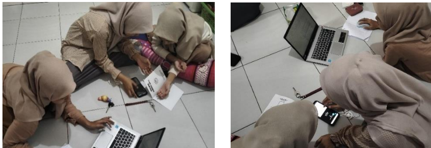
Gambar 3. Mahasiswa sedang kerja kelompok membentuk support system yang bisa memperkuat motivasi dan semangat belajar mahasiswa.

Kelima mahasiswa menunjukkan bahwa kebutuhan akan keterkaitan sosial sangat memengaruhi semangat dan ketekunan belajar mereka. Baik melalui dukungan orang tua, pengaruh teman, maupun kesadaran akan perjuangan keluarga, semua responden merasa bahwa mereka tidak sendirian dalam perjuangan akademiknya. Hasil wawancara ini menunjukkan bahwa keterkaitan yang dibangun melalui support system yang sehat mampu meningkatkan motivasi intrinsik dan memperkuat ketekunan belajar. Mahasiswa yang merasa diterima, dihargai, dan didukung secara emosional lebih mampu menghadapi tantangan akademik dengan tekun dan penuh semangat.