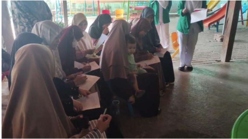
Gambar 2. Pengisian Kuesioner Peserta Pengabdian

Partisipasi mitra pada kegiatan pengabdian ini yaitu mitra menyediakan tempat serta sarana dan prasarana yang dibutuhkan pada kegiatan pengabdian.