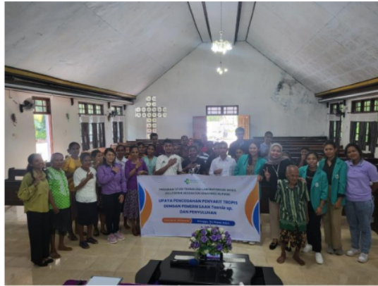
Gambar 3. Gambaran kegiatan pengabdian kepada masyarakat di desa Bone Kecamatan Nekamese

https://www.topnewsntt.com/berita/sebarkan-kesadaran-selamatkan-generasi-dosen-poltekkes-kemenkes-kupang-beri-penyuluhan-dan-pemeriksaan-taeniasis-di-desa-bone/