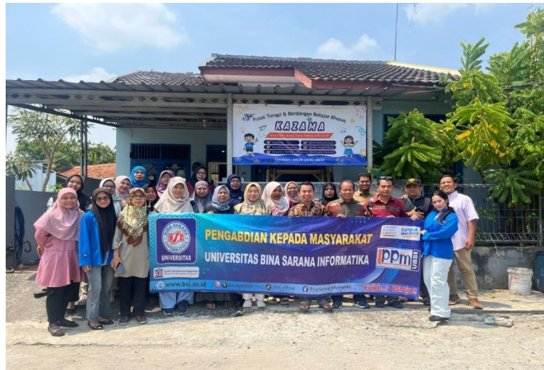
Gambar 6. Foto bersama Peserta Pengabdian Masyarakat yang terdiri dari Orang tua dan Pengelola sekolah anak berkebutuhan khusus.