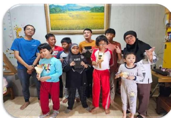
Gambar 2 Aktivitas Anak Berkebutuhan Khusus, bersama guru dan orang tua, pada Lembaga KAZAMA.