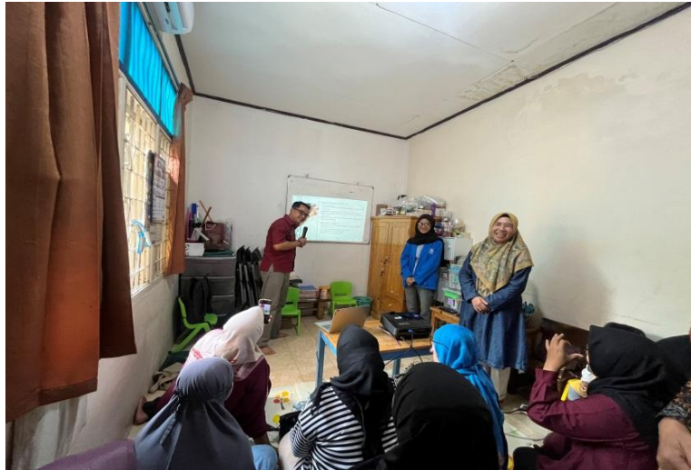
Gambar 5. Penyampaian Materi Pelatihan.