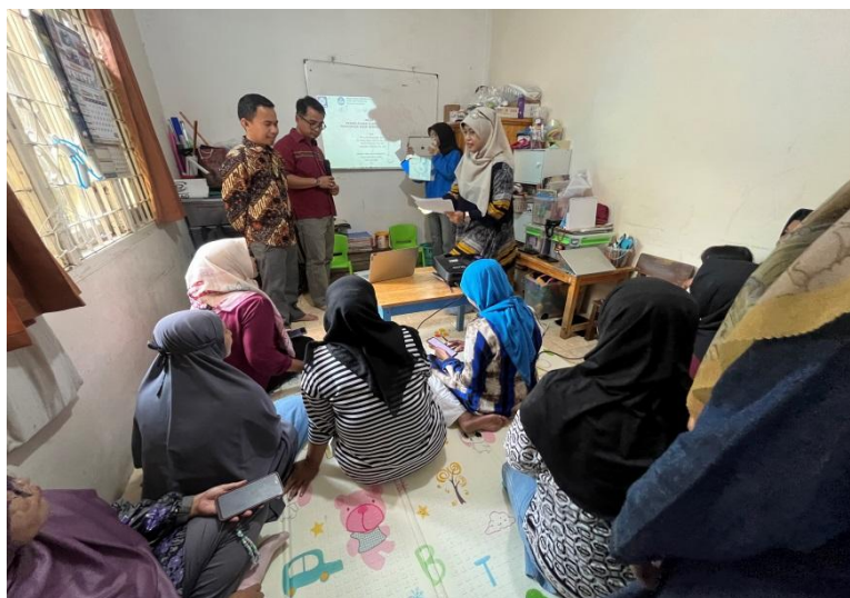
Gambar 7. Penyebaran questioner sebagai monitoring dan evaluasi pelaksanaan PKM