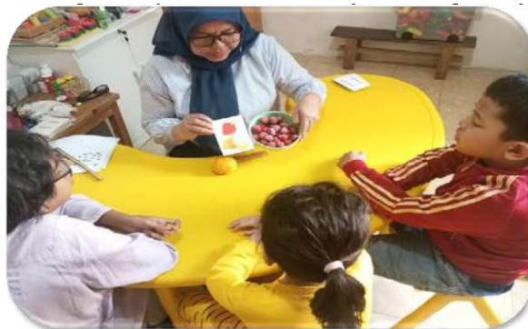
Gambar 1 Kegiatan Anak Berkebutuhan Khusus, pada Lembaga KAZAMA.

Adapun tujuan dari pendirian Lembaga Kazama, yaitu :