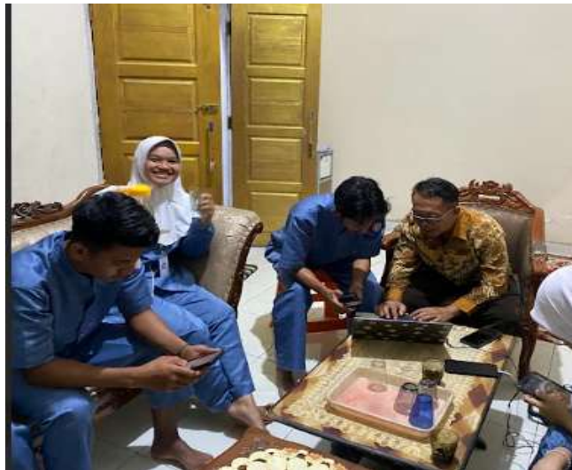
Gambar 2. Perencanaan

Pada tahap ini dilaksanaka perencanaan untuk melaksanakan kegiatan sosialisasi. Pada tahap perencanaan ini akan dibuat perencanaan tempat pelaksanaan sosialisasi website, penentuan sasaran sosialisai, persiapan materi untuk sosialisasi dan penentuan pembicara yang akan memberian sosialisasi. Pada tahap ini juga penyempurnaan fitur yang telah dikembangkan agar lebih fungsional dan sesuai dengan kebutuhan pengguna.