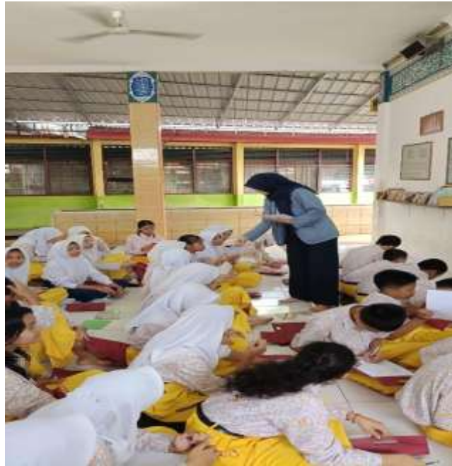
Gambar 5. Tahap Evaluasi Penggunaan Website