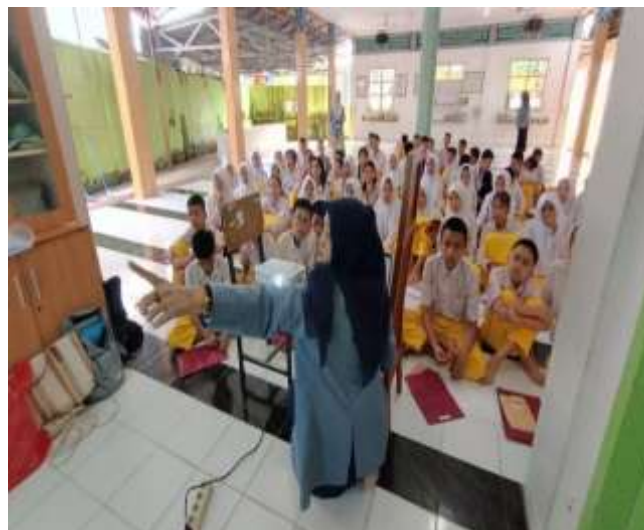
Gambar 4. Tahap Praktek

Pada tahap ini siswa dapat mempraktikkan cara penggunaan website. Pada saat praktik ini siswa juga dapat langsung mengisi fitur-fitur yang ada pada website. Pada tahap ini juga ditemukan siswa-siswa juga telah mengadakan bullying yang dialaminya pada saat di sekolah maupun pada saat berada di luar lingkungan sekolah.