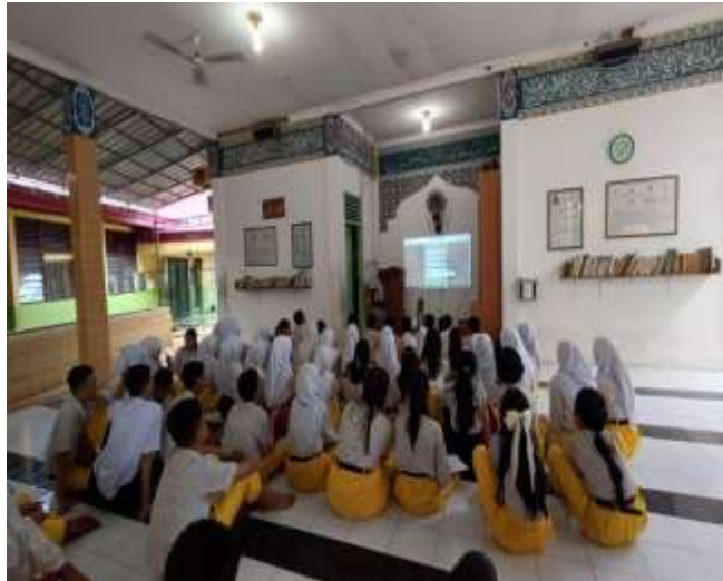
Gambar 3. Tahap Sosialisasi