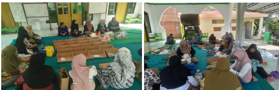
Gambar 1. foto-foto kegiatan PkM

Kegiatan Pengabdian Kepada Masyarakat telah dilaksanakan pada hari Minggu, 08 Juni 2025, jam 09.30 14.00 WIB, tempat kegiatan di Balai RW RW 15 dengan jumlah peserta dari PKK sejumlah 20 ibu.. Berikut merupakan foto-foto kegiatan PkM.