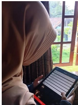
Gambar 3. Penerapan Aplikasi APTAQU Kepada Santri Disabilitas

Di lingkungan pesantren, perubahan sosial yang signifikan mulai terjadi karena keseriusan pendampingan tersebut. Pranata baru telah muncul untuk menggantikan metode konvensional yang selama ini kurang efektif untuk santri tunarungu. Ini termasuk belajar Al-Quran menggunakan aplikasi digital yang ramah disabilitas. Di antara perubahan perilaku yang dapat diamati adalah peningkatan keterlibatan santri dalam kegiatan keagamaan dan peningkatan kemampuan mereka sendiri untuk mendapatkan materi tafsir. Selain itu, proses ini meningkatkan kesadaran pengelola pesantren dan santri akan pentingnya teknologi sebagai alat bantu inklusi yang dapat meningkatkan pemahaman dan penghayatan Al-Quran.