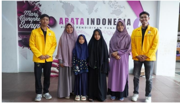
Gambar 2. Kunjungan di Pesantren Tunarungu ABATA Temanggung

Di lingkungan pesantren, perubahan sosial yang signifikan mulai terjadi karena keseriusan pendampingan tersebut. Pranata baru telah muncul untuk menggantikan metode konvensional yang selama ini kurang efektif untuk santri tunarungu. Ini termasuk belajar Al-Quran menggunakan aplikasi digital yang ramah disabilitas. Di antara perubahan perilaku yang dapat diamati adalah peningkatan keterlibatan santri dalam kegiatan keagamaan dan peningkatan kemampuan mereka sendiri untuk mendapatkan materi tafsir. Selain itu, proses ini meningkatkan kesadaran pengelola pesantren dan santri akan pentingnya teknologi sebagai alat bantu inklusi yang dapat meningkatkan pemahaman dan penghayatan Al-Quran.