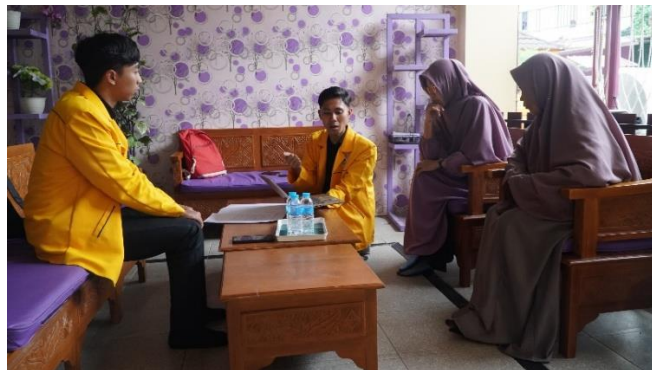
Gambar 4. Penjelasan Aplikasi APTAQU kepada Guru