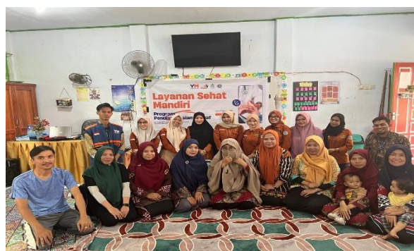
Gambar : Kegiatan edukasi berbasis karakteristik keluarga